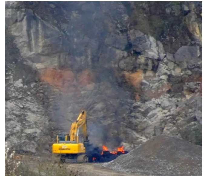
Pollution : anciens tapis convoyeurs brûlés