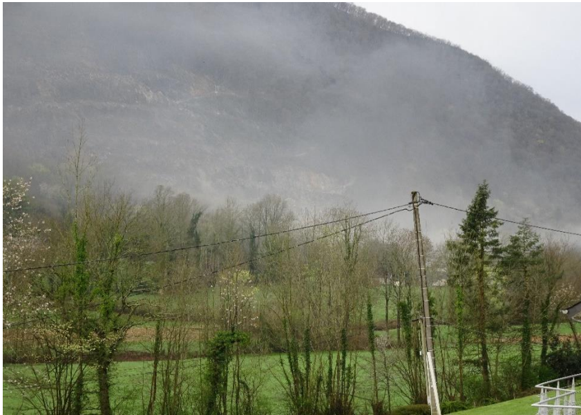
La poussière se diffuse sur tout le Bager