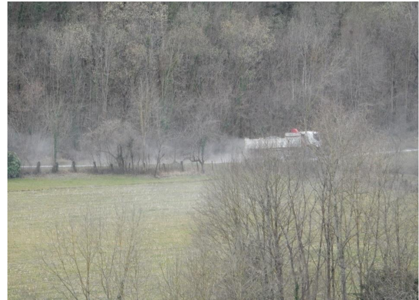
Poussière soulevée lors du passage des camions