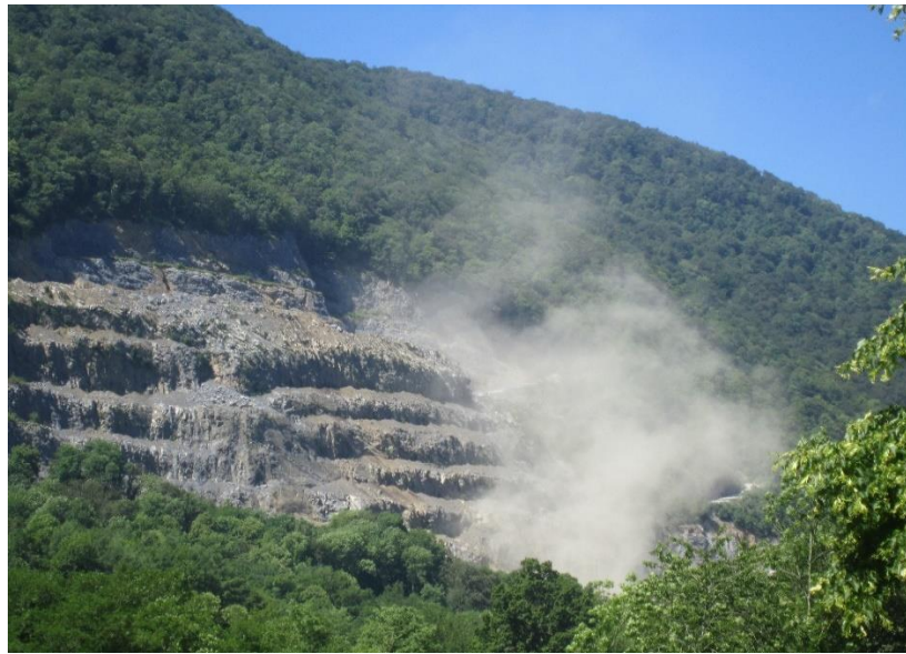
Poussières produites sur le concasseur