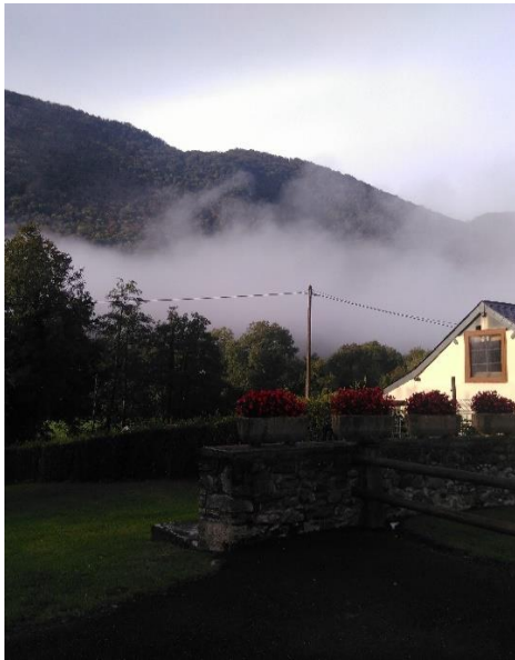
Nuage de poussière